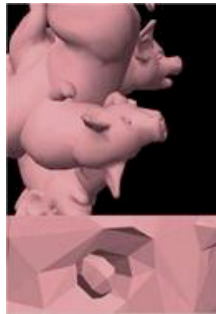
Ballet de porcelet dans Crumple Zone.

Politiquement incorrecte. Car Cécile n'en est pas à